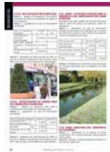
échos du cm 2