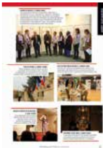
arrêt sur images