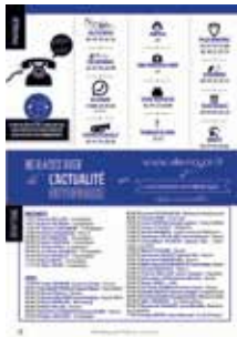
pratique & état-civil