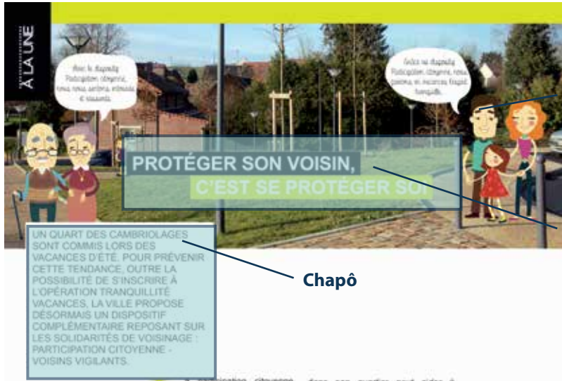
Photographie 1/3 de page

Il s'agit d'un article PLUS COMPLET QU'UNE BRÈVE QUI NE DOIT PAS DÉPASSER LES 2 000 SIGNES (ESPACES COMPRIS) . Il est agrémenté d'un Parole d'élus ou encore d'un encart chiffres clés.