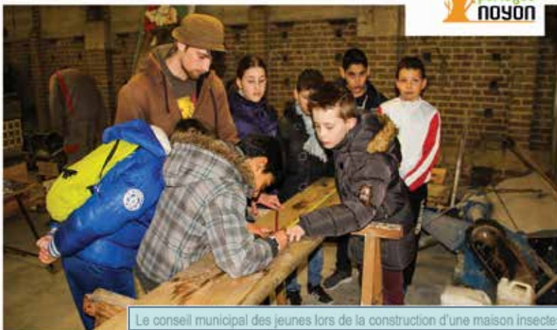
Le conseil municipal des jeunes lors de la construction d'une maison insectes