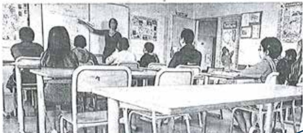
Les élèves absents plus de quatre demi-journées par mois et leurs parents pourraient être reçus par les délégués du procureur pour un rappel à la loi. Objectif : faire de la prévention et éviter la suspension des allocations familiales.

Le constat est sévère : 246 signalements ont ainsi été opérés dans l'Oise au cours des cinq premiers mois de 2011. Des signalements pour des élèves absents au moins quatre demi-journées par mois des bannières du collège ou du lycée. Elisabeth Laporte, inspectrice d'académie, et Jean-Philippe Vicentini, procureur de la République de Beauvais, ont réuni lundi dans un collège beauvaisien l'ensemble des chefs d'établissement relevant du ressort de la ville-préfecture. Objectif : leur présenter le cadre d'un partenariat de la lutte contre l'absentéisme scolaire. « Concrètement, les élèves qui seraient signalés pour absentéisme seraient reçus avec leurs parents par les délégués du procureur qui leur rappelleraient la loi relative à l'obligation scolaire et les risques encourus en cas de non-respect de leurs obligations, explique l'inspectrice d'académie. Nous devons être réactifs dans le repérage et le traitement de l'absentéisme, ce qui évitait d'avoir à recourir à la suspension des allocations familiales. » Depuis septembre 2010, la loi dite Clottier-Perotin en effet qu'à partir de