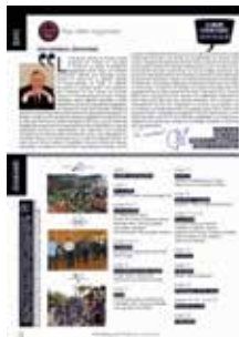
édite & sommaire