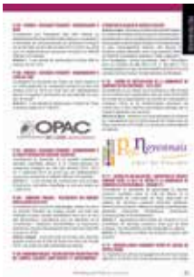
échos du cm 3